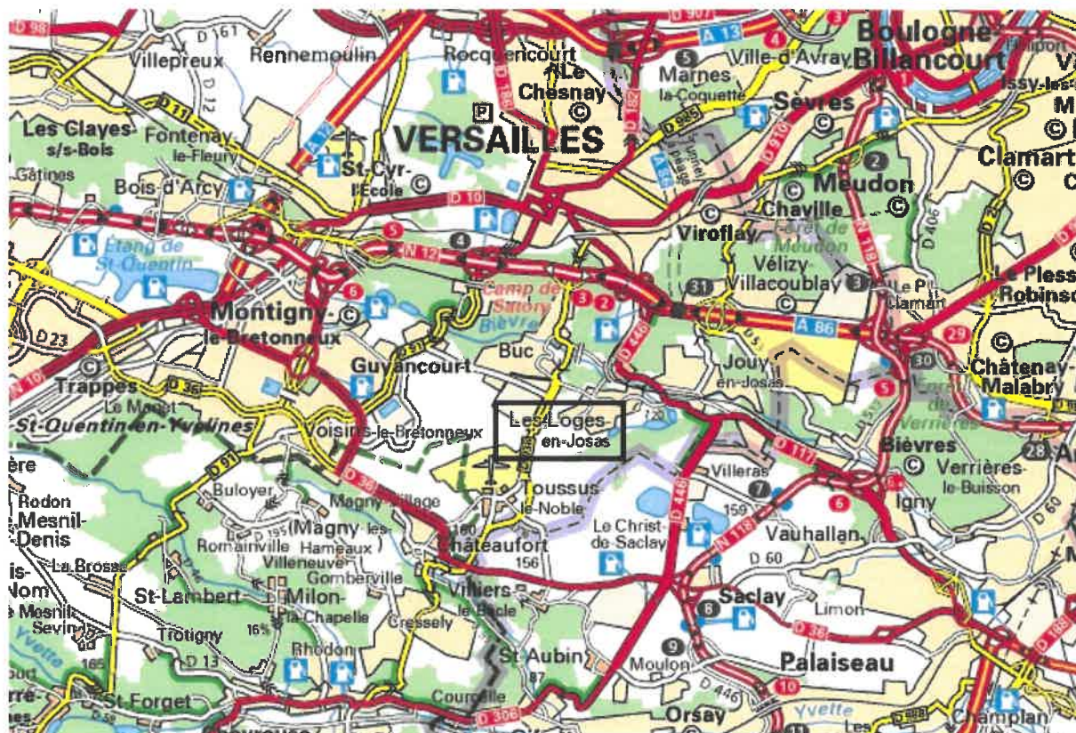
Carte du réseau routier autour des Loges

L'aérodrome de Toussus-le-Noble se trouve à deux kilomètres du village.