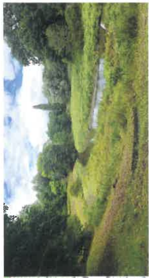
▲ Restauration de la zone humide Vigénis Amont par vidange du bassin (2017) à Massy par le SIAVB.