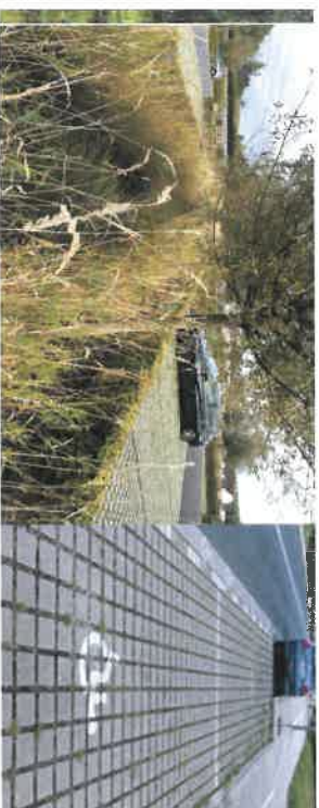
▲ Pavés non jointifs et noue en cœur de parking.