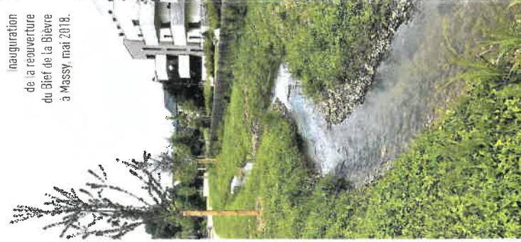
inauguration de la reouverture du Bief de la Bièvre à Massy, mai 2018.