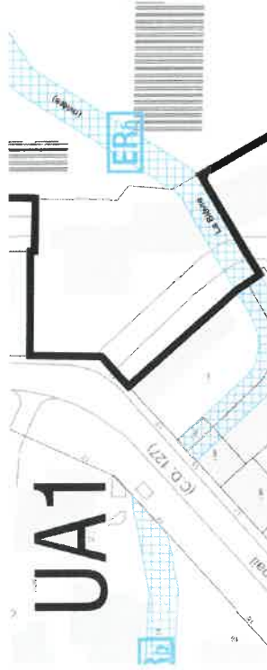
▲ Emplacements réservés (ER) de part et d'autre de la canalisation de la Bièvre. Extrait du plan de zonage du PLU de Gentilly, approuvé le 26 avril 2007.

Le SAGE est un outil d'aménagement du territoire qui planifie la gestion de la ressource en ea