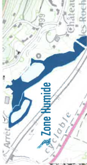
▲ Extrait de l'inventaire des Zones Humides avérées du SAGE de la Bièvre réalisé en 2013 (Château des Roches et ses abords à Bièvres).

Des emplacements réservés peuvent être utilisés sur le plan de zonage pour imposer ces marges de recul.