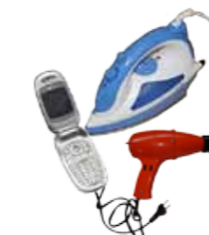
Petits appareils électriques ménagers (DEEE)