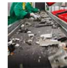
Démantèlement et tri des matières