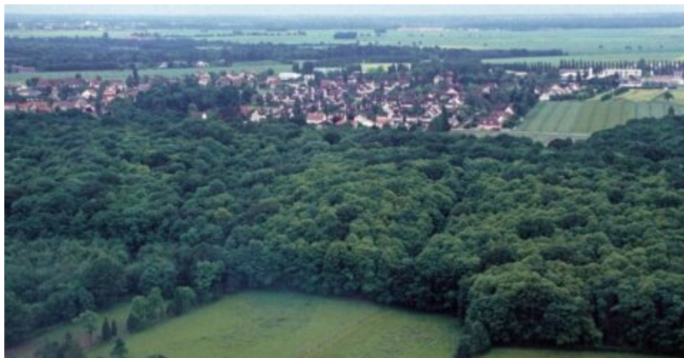
Patrimoine naturel des Loges-en-Josas