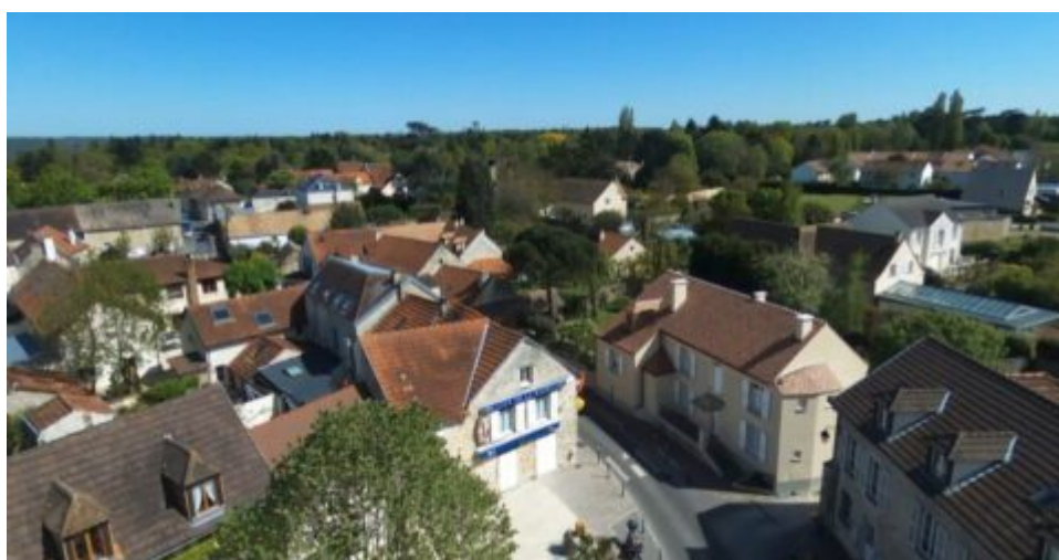
Patrimoine historique des Loges-en-Josas