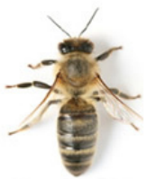
Abeille domestique ( Apis mellifera )

Il est crucial de savoir le distinguer du frelon européen, également connu sous le nom de « Crabos ». Contrairement au frelon asiatique, le frelon européen est peu agressif envers les humains, il sort principalement à la tombée de la nuit et se distingue par son corps jaune et sa tête rouge et noire. De plus, il joue un rôle bénéfique dans la lutte contre le frelon asiatique, ce qui en fait une espèce à protéger.