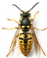
Guêpe commune ( Vespula vulgaris )