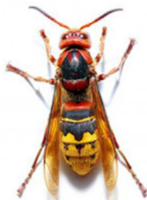
Frelon européen ( Vespa crabro )