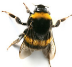
Bourdon terrestre ( Bombus terrestris )