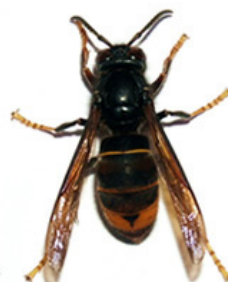
Frelon asiatique ( Vespa velutina )