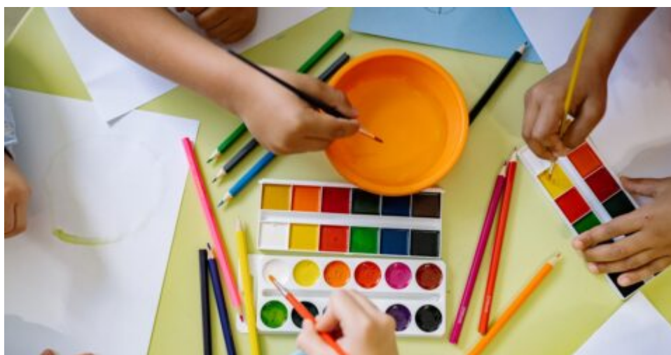
Centre de Loisirs - ALSH